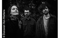
Gefördert von: KULTURRÄDET